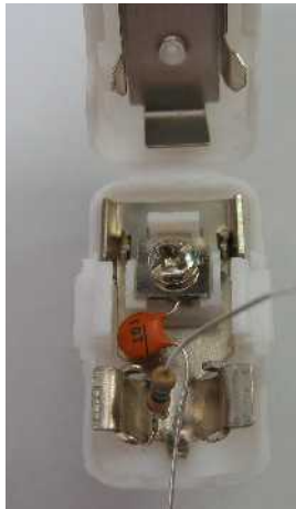
④ 抵抗器を編線部にねじり留め