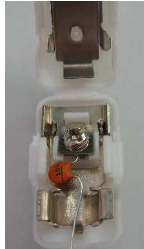
③ コンデンサーを芯線部にネジ留め