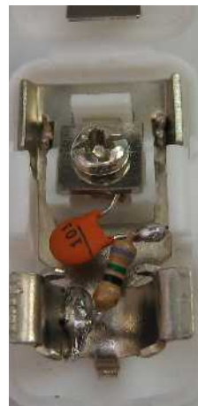
⑥ 抵抗器の両端をハンダ付け