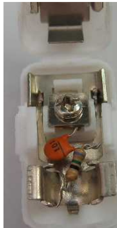
⑤ 部品同士をねじり留め