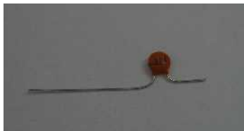
① コンデンサーの片足をカット